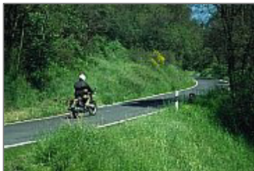
Tourenparadies Taunus