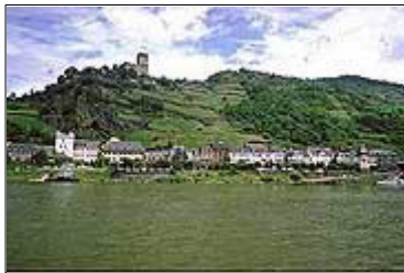
Romantische Orte zwischen Wasser und Wein: St. Goarshausen am Mittelrhein