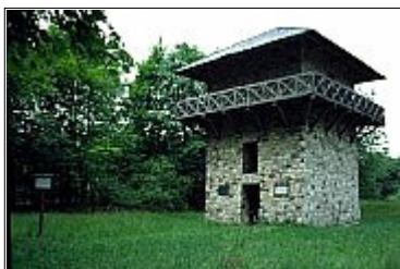
Weltkulturerbe Limes: Römischer Wachturm an der Hühnerstraße bei Taunusstein