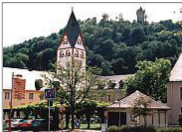
Hausburg der Naussauer hoch über dem Berg