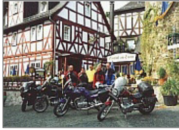
Gute Stimmung am Turm Clubtreffen am mittelalterlichen Marktplatz von Braunsfels