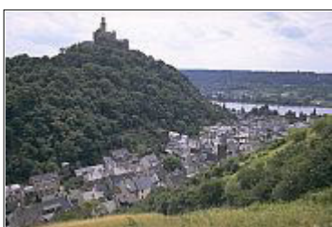
Braubach am Rhein mit der unzerstörten Marksburg