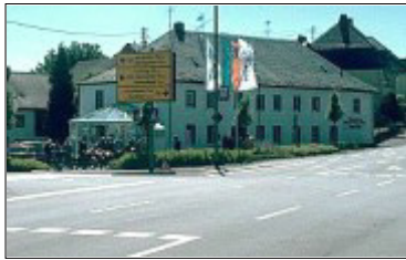
Oldtimertreffen am Otto-Museum in Holzhausen a.d. Haide