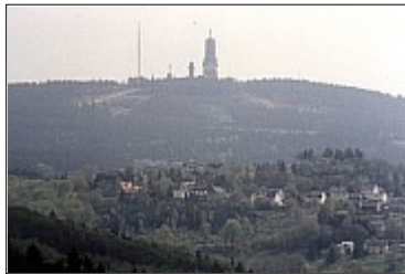
Feldberg mit Schmittener-Oker