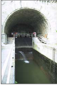
"Wasser Marsch": Doppelschleuse am Weilburger Schiffstunnel