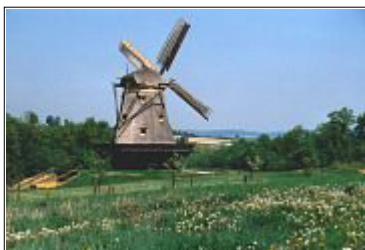
Museale Mühlenromantik: Hessenpark bei Neu-Anspach