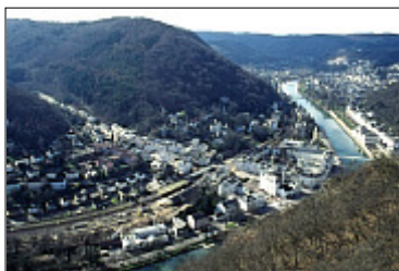
Kurort europäischer Fürsten: Bad Ems im Tal der Lahn

Geburtshaus von Nikolaus August Otto , dem Erfinder des nach ihm benannten Verbrennungsmotors. Im liebevoll eingerichteten Otto-Museum sind zahlreiche Original-Exponate zu bestaunen, die an das Wirken dieses Tüftlers erinnern, der die Welt der Menschen bis in die heutigen Jahre veränderte: Der Motor ist die treibende Kraft, egal ob Kraftwagen, Motorrad, Flugzeug oder Ackergerät (tgl. von 9.00 - 16.00 h).