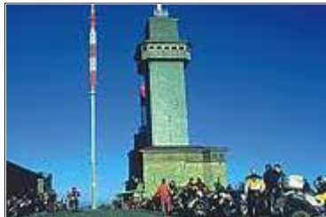
Ei, wieh! Ei, joh! Benzingespräche auf Frankfurts Hausberg