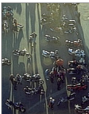
Bikerleben aus der Vogelperspektive: Blick vom Feldbergturm